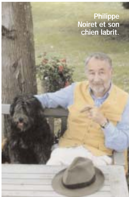
Philippe Noiret et son chien labrit.